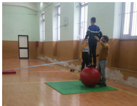
Laboratorio di conoscenza di sé presso il Centro di Formazione Professionale Cnos Fap Redentore