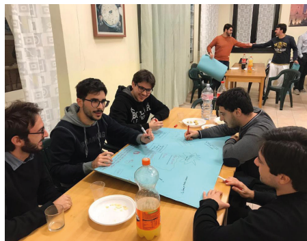
Incontro dei giovani universitari CUSMIR