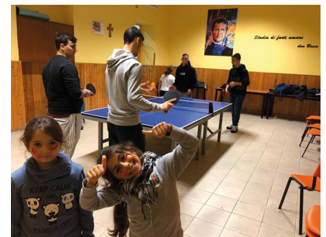
Laboratorio di Ping-Pong