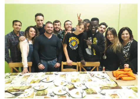
Comunità Educativa per Minori "16 Agosto"